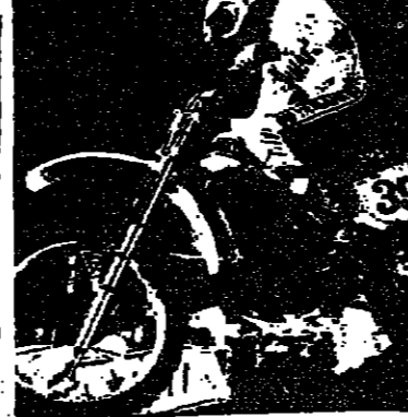
مشروع قفزة مايك بيل

واختلط المشهد من جديد بصورة فجائية عندما وصل الجميع الى المرتفع الترابي المعروف باسم مرتفع (التويوتا) لان هذه الشركة اليابانية بنت هذا المرتفع خصيصا لاجل الدعاية والاعلان . امام هذا المرتفع لم يتراجع احد ولم